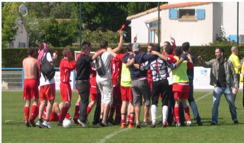
Qualification pour la finale de la Coupe Aristide Métayer (Juin 2011)

ET surtout inculquer un esprit et une ambiance basés sur les valeurs humaines et le plaisir d'être ensemble.